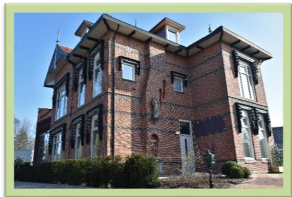
Huize Sonnevanck - Groenlo – geopend februari 2018

Nieuw in 2018 is de mogelijkheid het verblijf te financieren door middel van het Eerstelijnsverblijf . Dit is bedoelt voor veelal kwetsbare ouderen, waarvoor het tijdelijk nodig is om op schalen naar 24-uurs zorg vanuit hun thuissituatie of om af te kunnen schalen na ziekenhuisopname. Eminent Wonen & Zorg heeft contracten voor dit type zorg met diverse zorgverzekeraars en afspraken met omliggende ziekenhuizen en huisartsen.